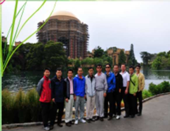
▲ 08' 장기교육 과정 해외연수모습