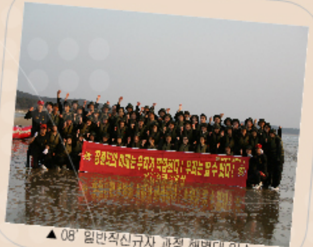
▲ 08' 일반직신규자 과정 해병대 입소