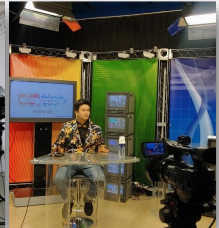
익산시청 공무원 온라인 강의