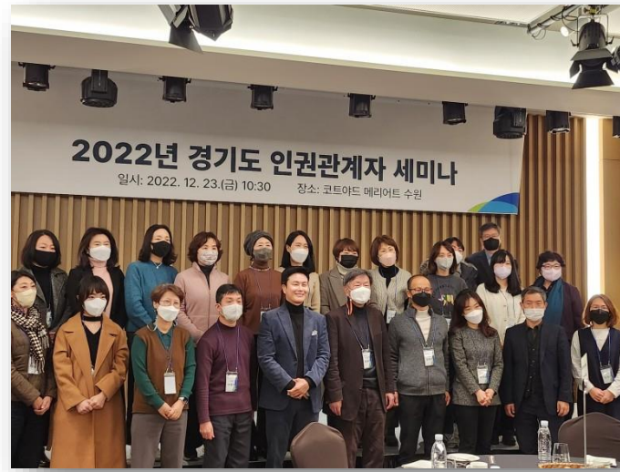
경기도 인권관계자 대상 인권강의