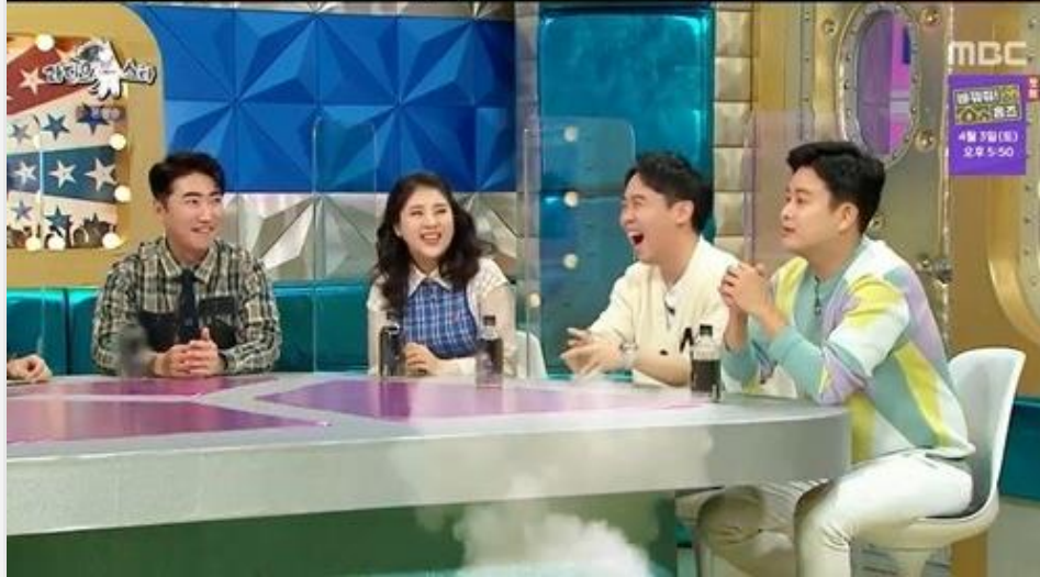
MBC 라디오 스타