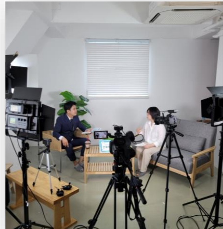
학부모대상 다문화 강의 영상