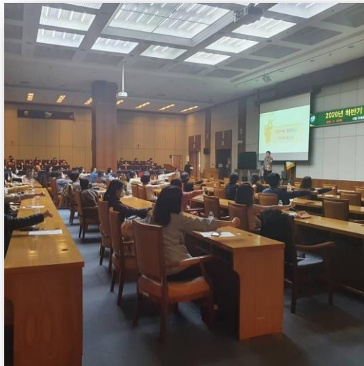
부산시청 공무원대상 다문화 강의