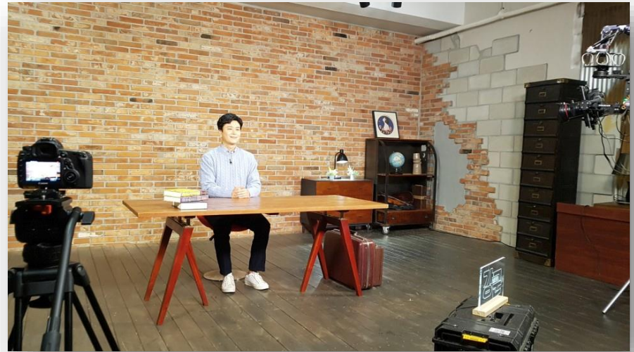
전국 군장병대상 다문화 강의 콘텐츠 영상 제작