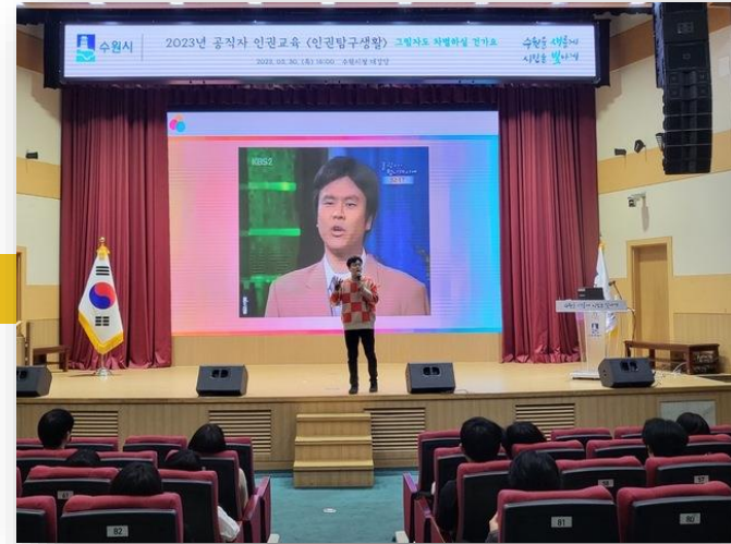
수원시청 공무원 대상 인권강의 (1,100명)