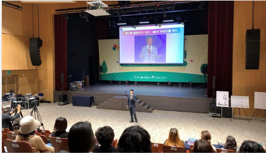
대구시청 지역주민대상 인권강의